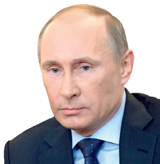
Владимир ПУТИН, президент Российской Федерации:

В рамках Всероссийского форума «Родные-любимые» през